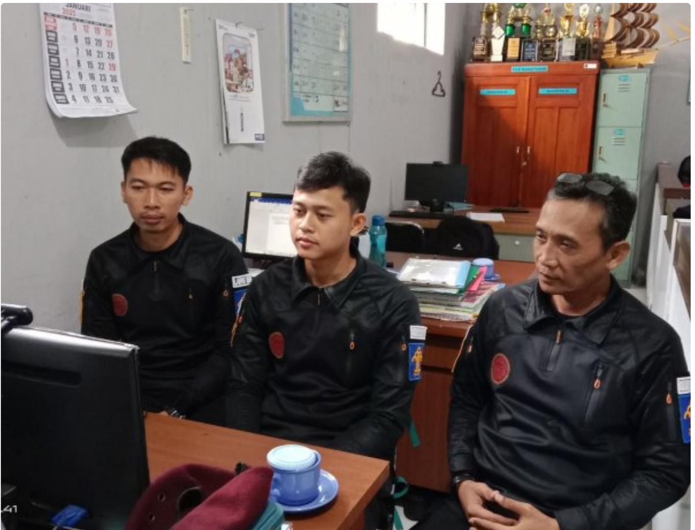
Bangun Harmoni dan Strategi, Lapas Besi Ikuti Webinar Refleksi Akhir Tahun 2024 & Resolusi 2025

CILACAP – Sebagai salah satu langkah dalam pengembangan kompetensi bagi Aparatur Sipil Negara (ASN), Petugas Lembaga Pemasyarakatan Kelas IIA Besi berpartisipasi dalam kegiatan webinar bertajuk "Refleksi Akhir Tahun 2024 dan